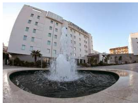
Centrum Palace (Centrum Palace)