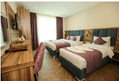
Royal Palace (Van)