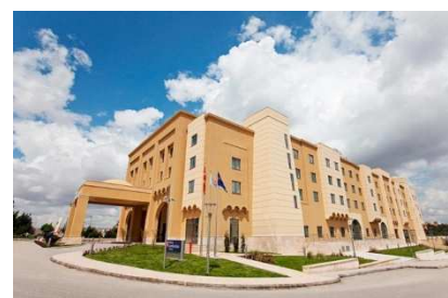
Hilton Garden Inn (Sanliurfa)