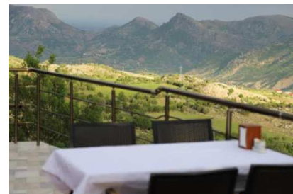
Nemrut Euphrat (Kahta)