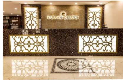
Saprán Deluxe (Kars)