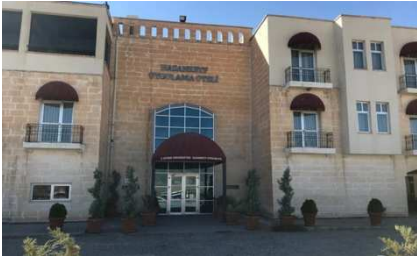
Hasankeyf Uygulama (Hasankeyf)

(1) En caso de que no hubiese ningún pasajero más para compartir habitación, el viajero deberá abonar suplemento por habitación individual obligatoriamente.