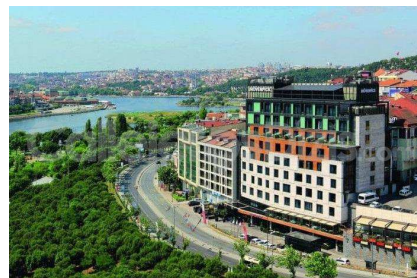
Mövenpick Golden Horn (Estambul)