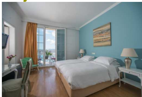
City Marina (Corfú)