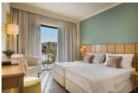
Ionian Plaza (Argostoli)