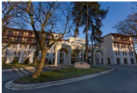
Grand Serai Congress & Spa (Ioannina)