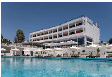
Magarona Royal (Preveza)