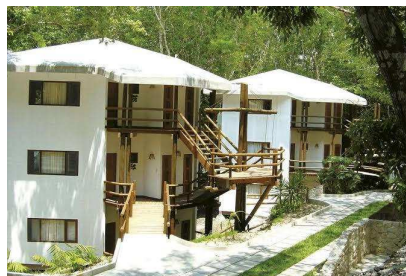
Maya International (Flores)

(1) En caso de que no hubiese ningún pasajero más para compartir habitación, el viajero deberá abonar suplemento por habitación individual obligatoriamente.