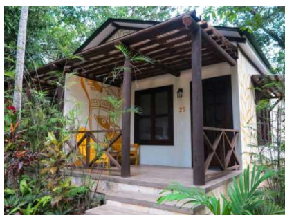
Jungle Lodge (Tikal)