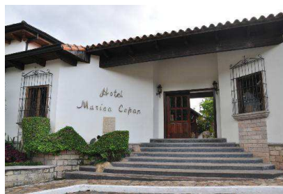
Marina (Copán Ruinas)