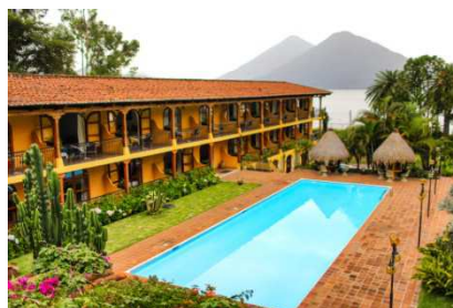
Villa Santa Catarina (Lago Atitlán)