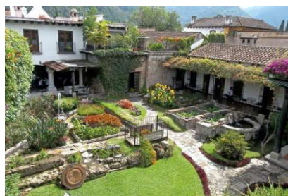
Posada Don Rodrigo (Antigua)

Ampliación seguro: coberturas mejoradas de asistencia en viaje (Mapfre: póliza 698/140, consultar más abajo) y/o coberturas por cancelación de viaje por causas justificadas (Mapfre: póliza 661/78 hasta 3.000 €, consultar más abajo). Si desea contratar una póliza que cubra más de 3.000 € por cancelación de viaje por causas justificadas (Mapfre), o una póliza de cancelación de viaje por libre desistimiento (Mapfre, InterMundial, AON o similar), consultar al realizar su reserva. No se incluyen bebidas en los almuerzos incluidos, cenas, traslados ni visitas diferentes a los especificados, ecotasa a abonar directamente en el hotel, extras en general (tales como servicio lavandería, propinas a chóferes y/o guías, llamadas telefónicas, etc.).