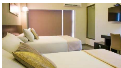
Remfort (Santa Ana)