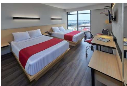
City Express (Comitán)