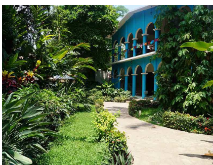
La Ceiba (Chiapa de Corzo)

Ampliación seguro: coberturas mejoradas de asistencia en viaje (Mapfre: póliza 698/140, consultar más abajo) y/o coberturas por cancelación de viaje por causas justificadas (Mapfre: póliza 661/78 hasta 3.000 €, consultar más abajo). Si desea contratar una póliza que cubra más de 3.000 € por cancelación de viaje por causas justificadas (Mapfre), o una póliza de cancelación de viaje por libre desistimiento (Mapfre, InterMundial, AON o similar), consultar al realizar su reserva. No se incluyen almuerzos ni cenas (salvo Cena de Fin de Año), bebidas, traslados ni visitas diferentes a los especificados, ecotasa a abonar directamente en el hotel, extras en general (tales como servicio lavandería, propinas, llamadas telefónicas, etc.).