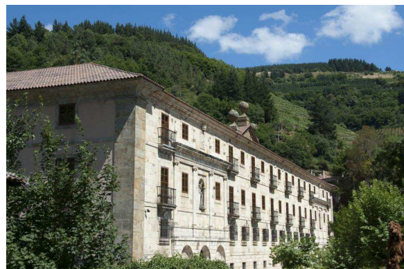
Parador de Corias

Ampliación seguro: coberturas mejoradas de asistencia en viaje (Mapfre: póliza 698/140, consultar más abajo) y/o coberturas por cancelación de viaje por causas justificadas (Mapfre: póliza 661/78 hasta 3.000 €, consultar más abajo). Si desea contratar una póliza que cubra más de 3.000 € por cancelación de viaje por causas justificadas (Mapfre), o una póliza de cancelación de viaje por libre desistimiento (Mapfre, InterMundial, AON o similar), consultar al realizar su reserva. No se incluyen almuerzos ni cenas, traslados ni visitas diferentes a los especificados, ecotasa a abonar directamente en el hotel, extras en general (tales como servicio lavandería, propinas, llamadas telefónicas, etc.).