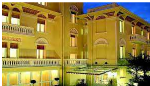
Relais Le Felci (Fiuggi)

Ampliación seguro: coberturas mejoradas de asistencia en viaje (Mapfre: póliza 698/140, consultar más abajo) y/o coberturas por cancelación de viaje por causas justificadas (Mapfre: póliza 661/78 hasta 3.000 €, consultar más abajo). Si desea contratar una póliza que cubra más de 3.000 € por cancelación de viaje por causas justificadas (Mapfre), o una póliza de cancelación de viaje por libre desistimiento (Mapfre, InterMundial, AON o similar), consultar al realizar su reserva. No se incluyen almuerzos ni cenas, traslados ni visitas diferentes a los especificados, ecotasa a abonar directamente en el hotel, extras en general (tales como servicio lavandería, propinas a chóferes y/o guías, llamadas telefónicas, etc.), maleteros en los hoteles.