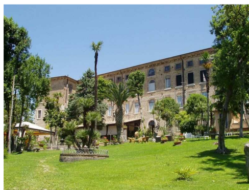
Il Cavalier d'Arpino (Arpino)