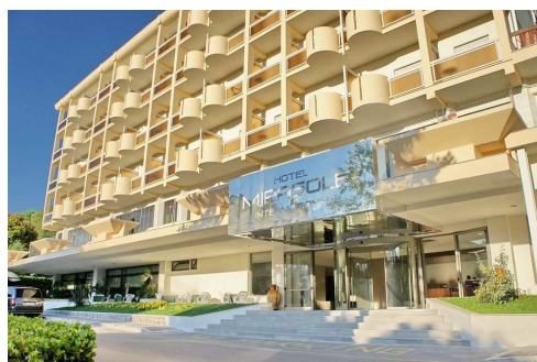
Mirasole International (Gaeta)