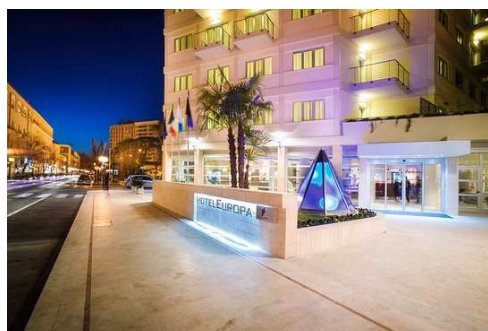
Europa Latina (Roma)