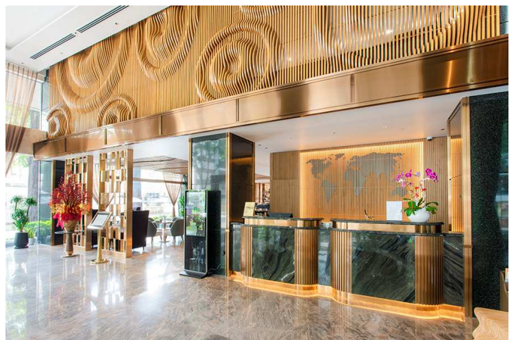
Northern (Ho Chi Minh)