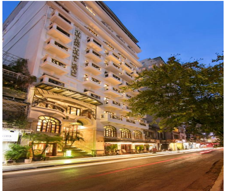
Thien Thai Hotel (Hanói)

Ampliación seguro: coberturas mejoradas de asistencia en viaje (Mapfre: póliza 698/140, consultar más abajo) y/o coberturas por cancelación de viaje por causas justificadas (Mapfre: póliza 661/78 hasta 3.000 €, consultar más abajo). Si desea contratar una póliza que cubra más de 3.000 € por cancelación de viaje por causas justificadas (Mapfre), o una póliza de cancelación de viaje por libre desistimiento (Mapfre, InterMundial, AON o similar), consultar al realizar su reserva. No se incluyen bebidas en los almuerzos incluidos, cenas, traslados ni visitas diferentes a los especificados, ecotasa a abonar directamente en el hotel, extras en general (tales como servicio lavandería, propinas a chóferes y/o guías, propinas a pequeñas embarcaciones locales y tripulación del crucero en la bahía de Halong, llamadas telefónicas, etc.), maleteros en los hoteles.