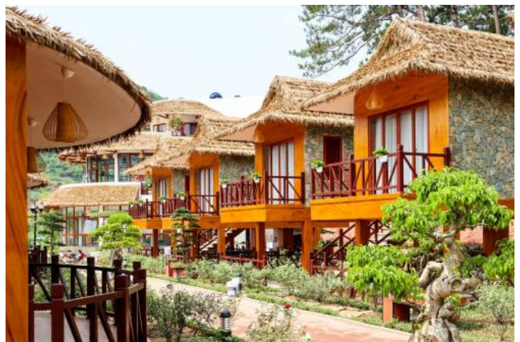
Moc Chau Eco Garden Resort (Moc Chau)