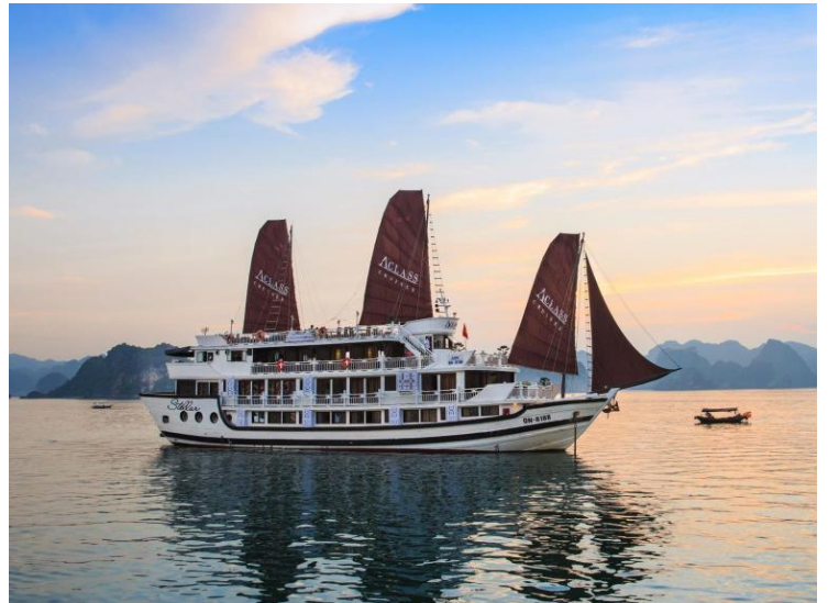
Aclass Stellar Cruise (Bahía de Halong)

(1) En caso de que no hubiese ningún pasajero más para compartir habitación, el viajero deberá abonar suplemento por habitación individual obligatoriamente.