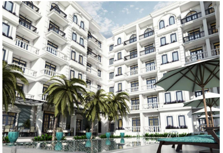
Rosemary (Hôi An)