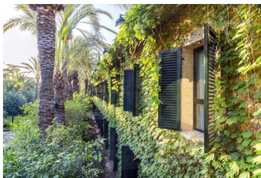
Port Jardín Milenio

Ampliación seguro: coberturas mejoradas de asistencia en viaje (Mapfre: póliza 698/140, consultar más abajo) y/o coberturas por cancelación de viaje por causas justificadas (Mapfre: póliza 661/78 hasta 3.000 €, consultar más abajo). Si desea contratar una póliza que cubra más de 3.000 € por cancelación de viaje por causas justificadas (Mapfre), o una póliza de cancelación de viaje por libre desistimiento (Mapfre, InterMundial, AON o similar), consultar al realizar su reserva. No se incluyen almuerzos ni cenas, traslados ni visitas diferentes a los especificados, ecotasa a abonar directamente en el hotel, extras en general (tales como servicio lavandería, propinas, llamadas telefónicas, etc.).